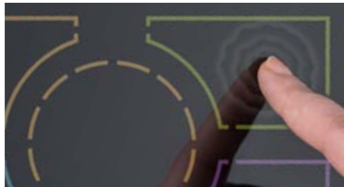
Taktile Rückmeldung beim Drücken