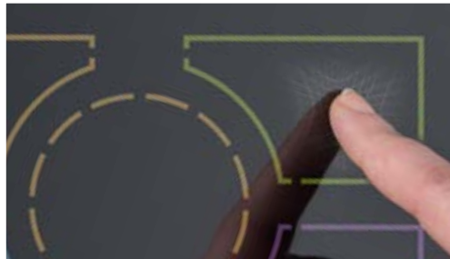
Nur gewollte Schaltaktionen auslösen - Force Sensing